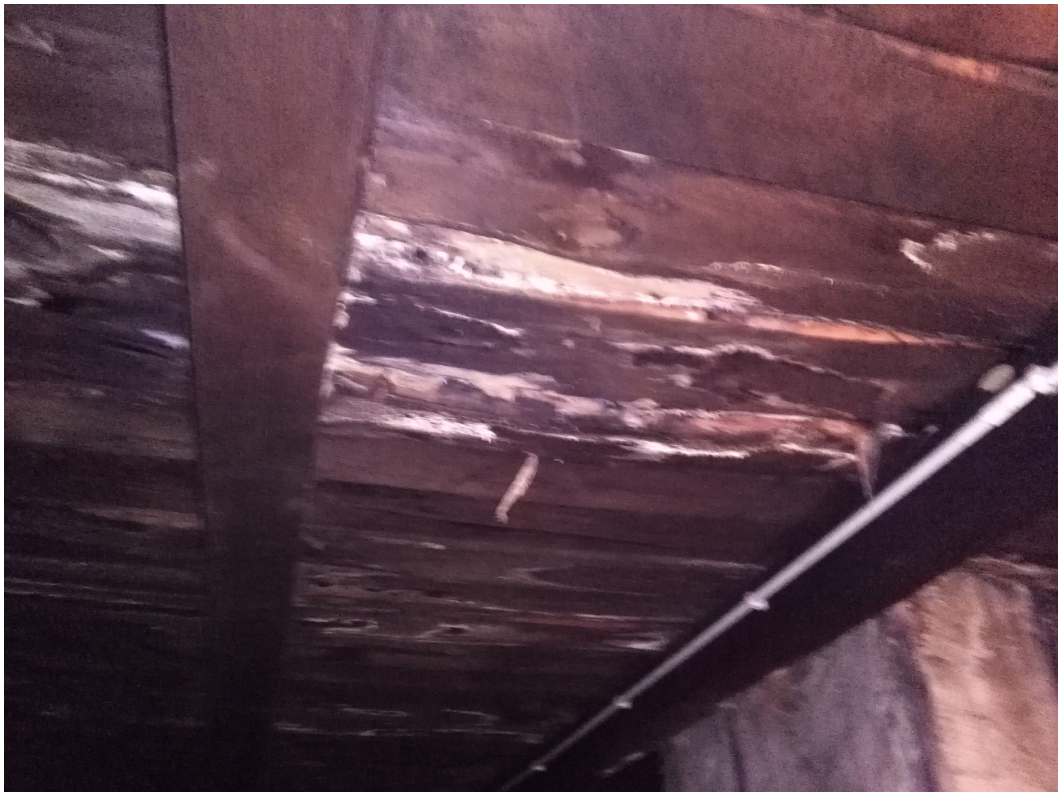
Rys. 6 Widoczne zawilgocenia elementów więźby dachowej