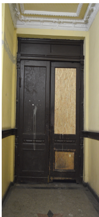
Rys. 3 Poszczególne elementy strefy wejściowej