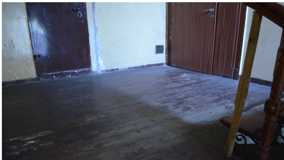
Rys. 2 Widok zniszczonych elementów klatki schodowej