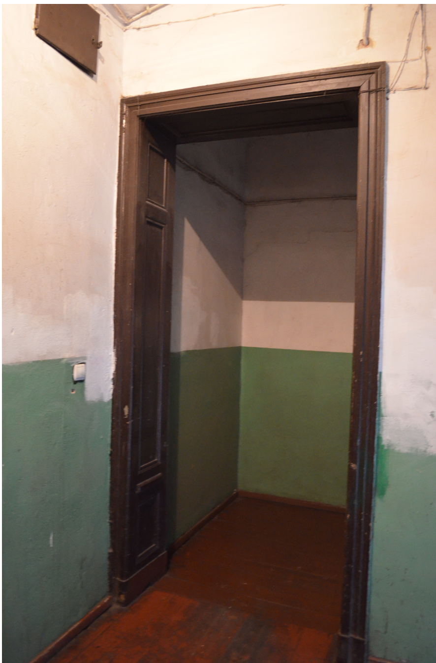
Rys. 3 Ozdobna ościeżnica oddzielająca klatkę schodową od korytarza prowadzącego do poszczególnych mieszkań