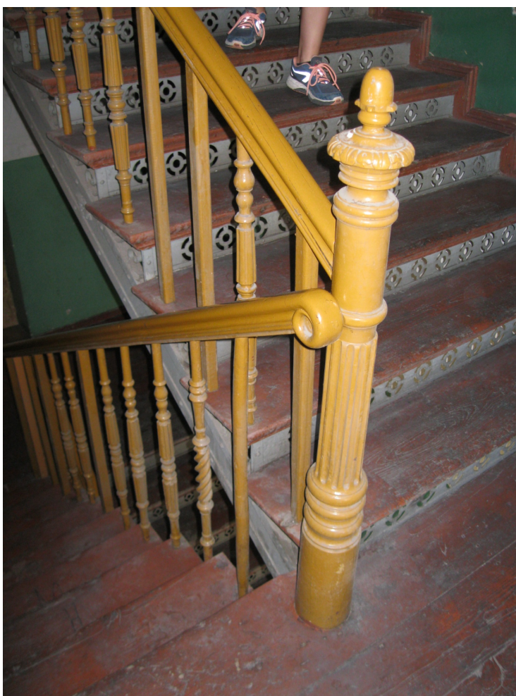
Rys.2 Widoczne niepasujące elementy drewniane schodów