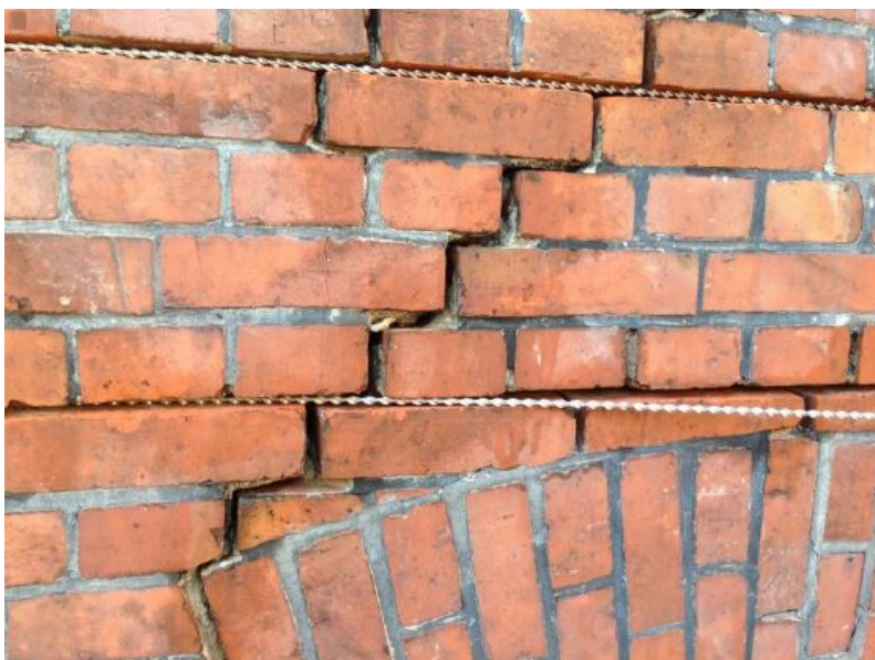
Rys. 1 Przykład montażu prętów systemowych w murze ceglanym