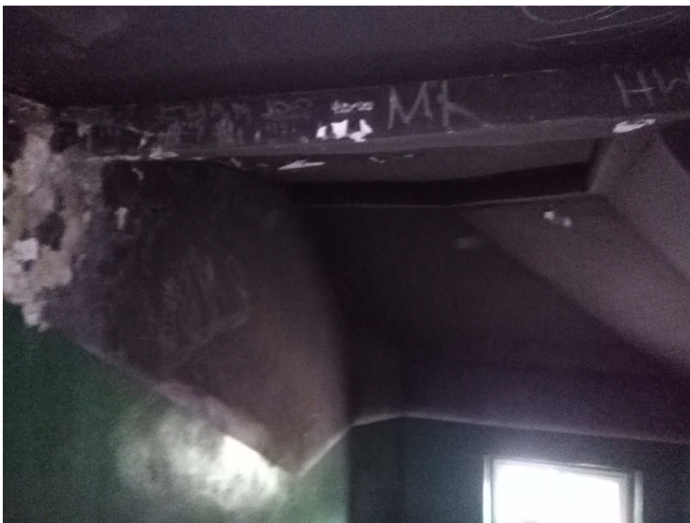
Rys.1 Widok zniszczeń sufitu ostatniej kondygnacji klatki schodowej